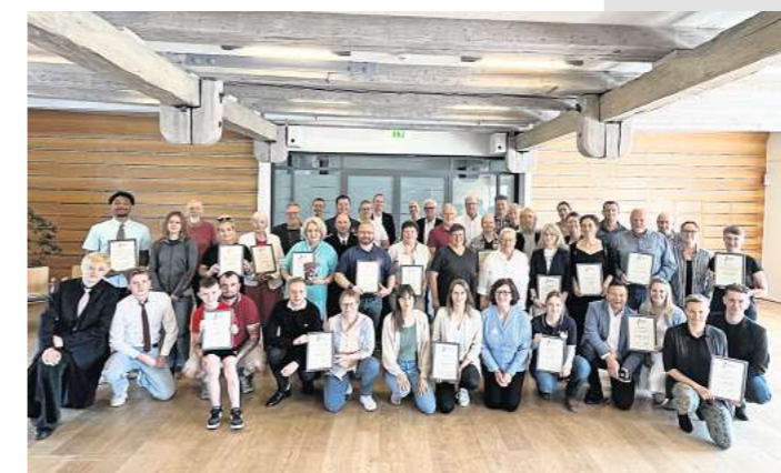
Über 76.000 Euro für Vereine - in diesem Jahr konnte die Wismarer Thomas-Agerholm-Stiftung 28 Projekte ermöglichen. Das Foto entstand bei der feierlichen Übergabe der Fördermittel im Wismarer Zeughaus.

Bedacht wurden weiterhin der Feuerwehrförderverein Wismar Altstadt (Feuerwehnhüpfburg), der Verein Kanonbra (Gründung eines »Lego Clubs«), die DRK-Kita »Am Holzhafen« (Medienprojekt), das Europäische Zentrum der Backsteinbaukunst, der Wismarer Archivverein (Buchprojekt »Wismar in Trümmern«), der Verein »Kuno« (Kulturfest 2026), die Schülerband der Goethe-Schule, das Jellyfish-Jazz-Orchestra, der Landesverband für angewandte Kunst (Messe »Fangfrisch«), die Evangelische Musikschule Wismar (Konzertprojekt »Songs of Spirit II«), der Bibliotheksverein Wismar (Kinderhoffest), Schüler der Wismarer Ostsee-Schule (Teilnahme am Hamburger Gesangsspektakel »6K United2«), Grundschule am Friedenshof (gesunde Ernährung), Tarnow-Grundschule (Pausenspiele), der Verein »Wismar hilft« (Schunkelfahrt für Senioren), das 25. Campus-Open-Air an der Hochschule Wismar, die Hundefreunde der Ortsgruppe Wismar-Umland (Bundesleistungshütten 2026), der Förderverein Rugby Rostock (Wettkampfkleidung), der Stadtjugendring Wismar (Kinderadventsmarkt).