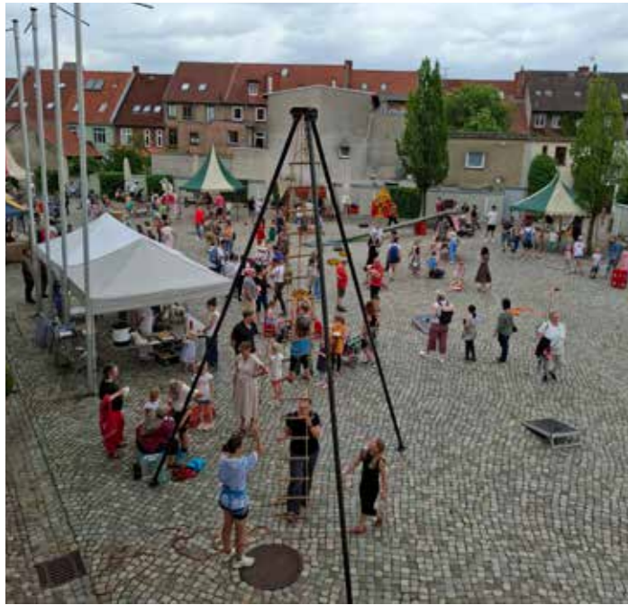
Das alljährliche Hoffest des Bibliotheksvereins im Zeughaus Wismar.