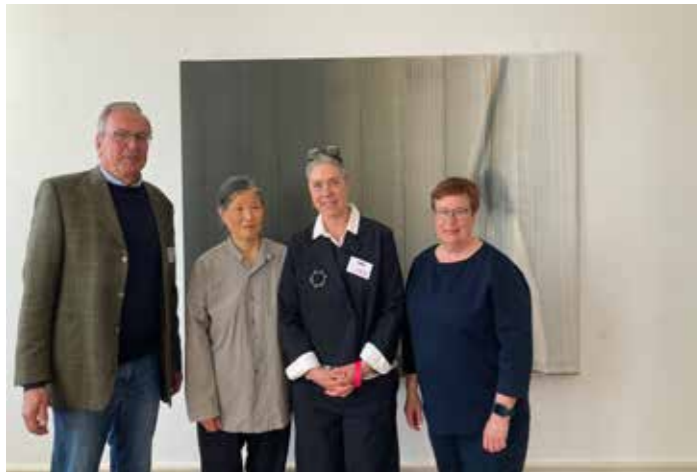
Vernissage im Palais für aktuelle Kunst Glückstadt mit der Ausstellung von der Künstlerin Hyun-Sook Song. (Förderung aus 2024)