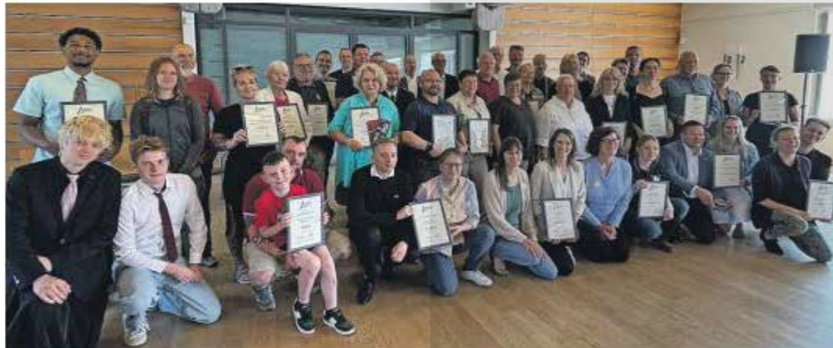
Im Zeughaus nahmen am 20. Juni Vereine aus dem Großraum Wismar die Förderungen der Thomas-Agerholm-Stiftung für ihre Projekte entgegen.