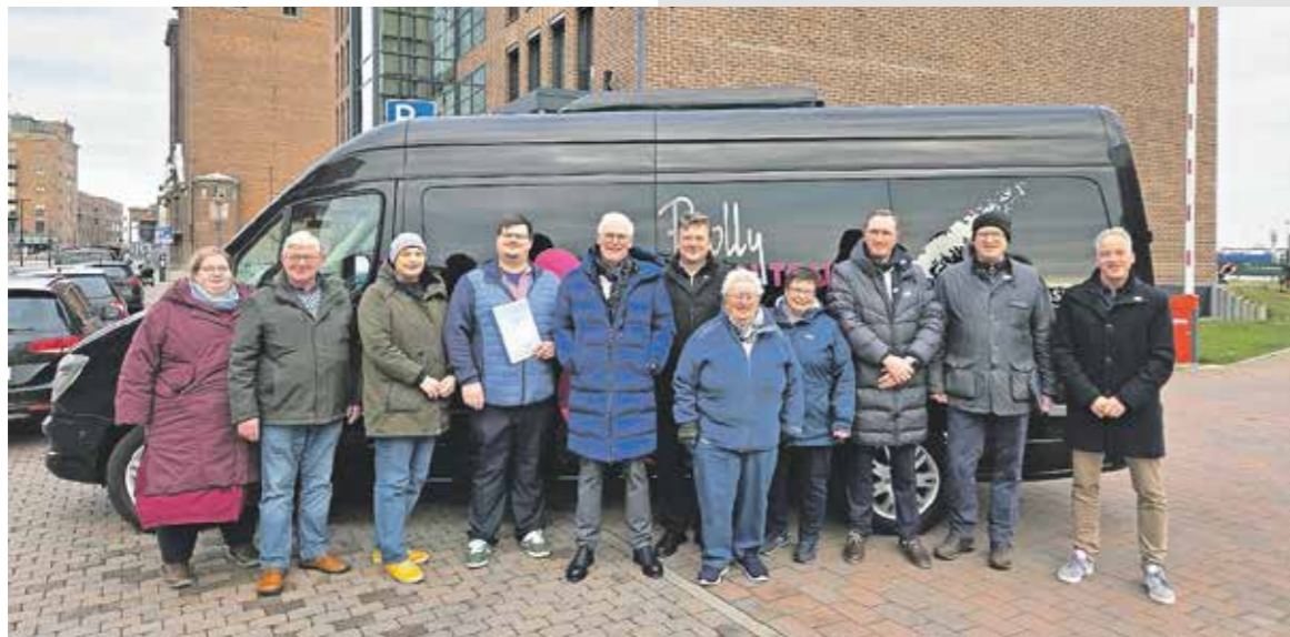
Vertreter des Vereins Engelshelfer e.V. nahmen den Transporter in der Stockholmer Straße entgegen. Für die Stiftung waren sowohl der Vorstand als auch der Stiftungsrat anwesend, um die Übergabe gemeinsam zu begleiten und die Arbeit des Vereins zu würdigen.

Agerholm-Stiftung unterstützt gemeinnützigen Verein