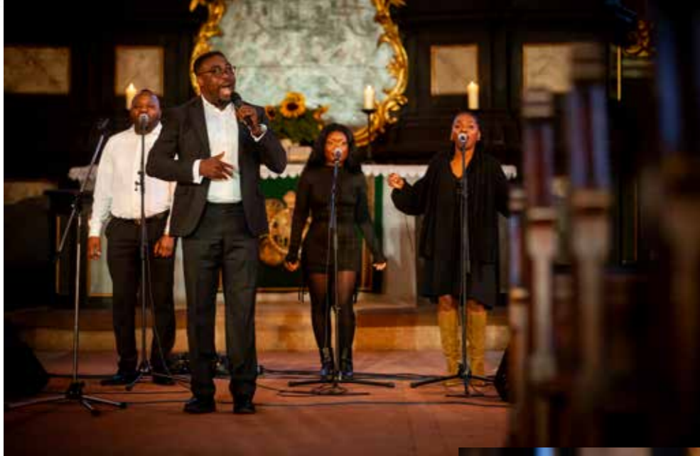
Afro Gospel unterhält die Gäste