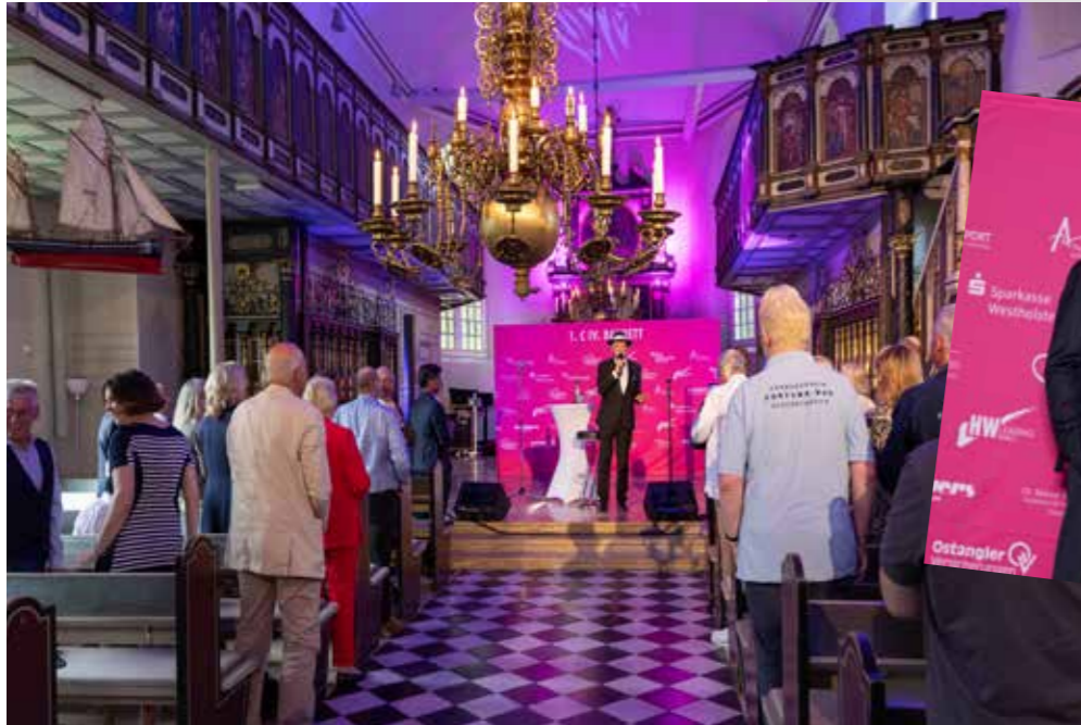
Sinatra Story von Jens Sörensen