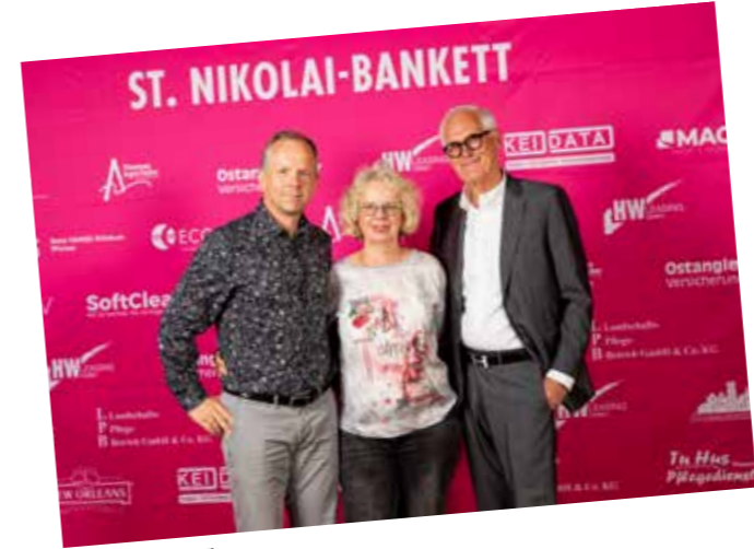
Ecovis - Sponsor