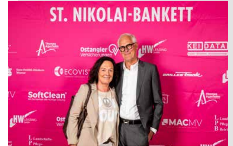
New Orleans - Sponsor