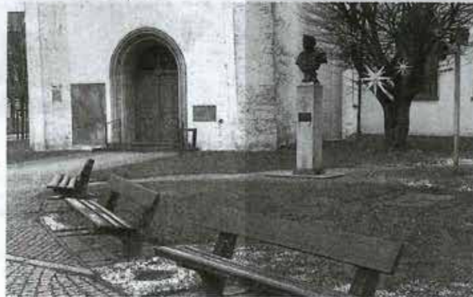
Das geplante Bankett kommt der Anschaffung neuer Sitzgelegenheiten vor der Stadtkirche am Marktplatz zugute.

Das gelte auch für das jüngste Projekt, das der frühere Glückstädter noch zu Lebzeiten plante und diesen Sommer realisieren wollte: ein festliches Bankett für den guten Zweck – ähnlich dem, das es in Agerholms Wahlheimat in Wismar bereits 15 Mal gab. Der Spendenzweck des Abends steht laut Renate Hoppe, stellvertretende Vorsitzende des Stiftungsrates, bereits fest: Die drei Sitzbänke vor der