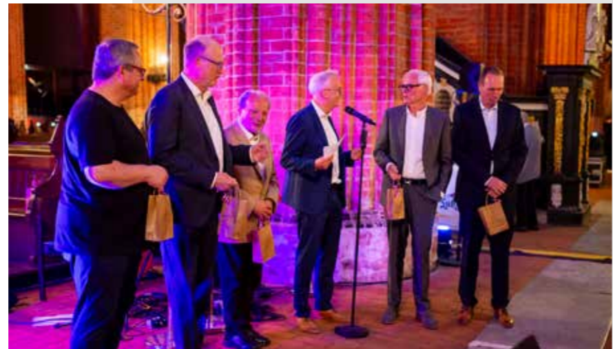
Die Promikellner und „Promikoch“ Tilo Gundlack