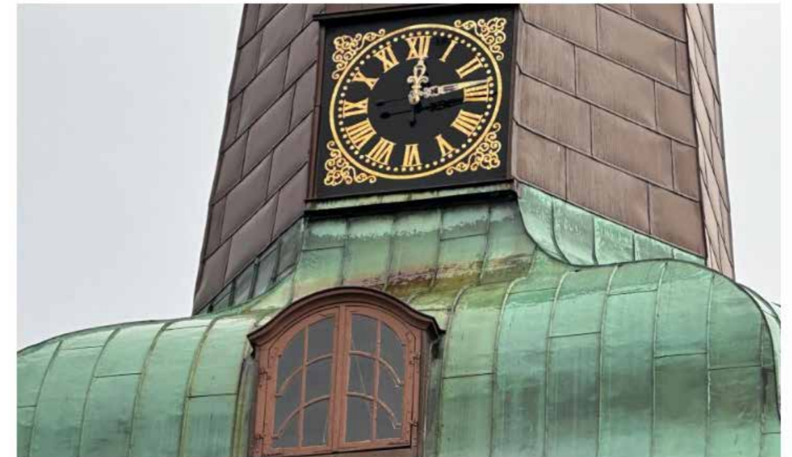
Der Erlös des Banketts soll in eine neue Bank vor der Stadtkirche investiert werden.