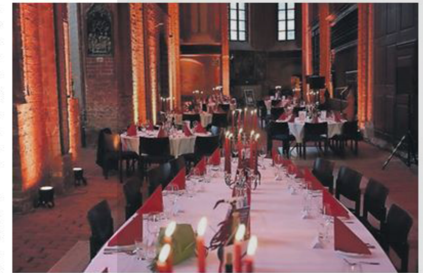
Zum Nikolaibankett werden die Tische in der Kirche festlich gedeckt.

Wie gewohnt erwartet die Gäste ein Drei-Gänge-Menü, dessen traditionelle Vorsuppe wieder von Tilo Gundlack zubereitet wird – ein kulinarischer Höhepunkt, der sich großer Beliebtheit erfreut. Auch der Eiswagen, längst ein liebgewonnenes Detail des Abends, wird wieder mit dabei sein. Luis Dannewitz wird die Gäste musikalisch zum Einlass sowie während des Essens begleiten und damit für eine