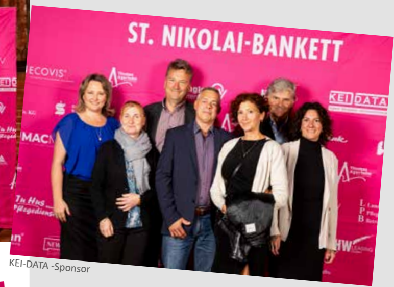
KEI-DATA - Sponsor