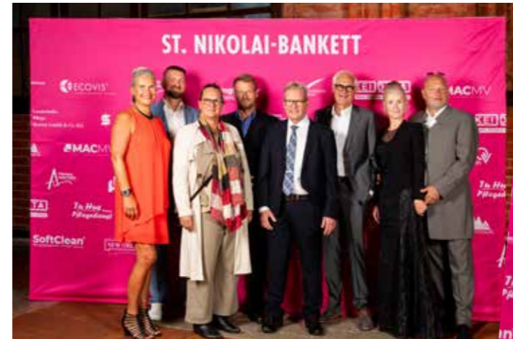
Brillen Frank - Sponsor